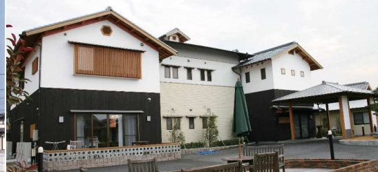
関連事業所：デイサービス香り