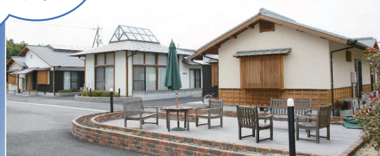
関連事業所：グループホーム和らぎ・歓び